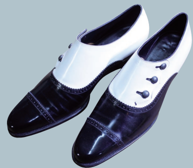
MISAWA & WORKSHOP(革靴製作) / 女性用オールドメイド革靴