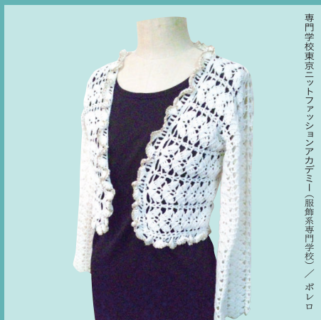
専門学校東京ニットファッションアカデミー(服飾系専門学校) / ボレロ