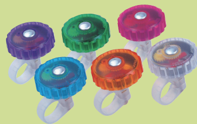
(株)東京ベル製作所(自転車用ベル製造) / 自転車ベル(クリスタルベル)