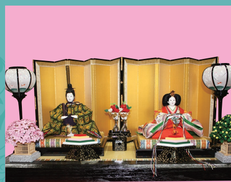
(有)竹中雛人形製作所(衣裳着人形) / 雛人形