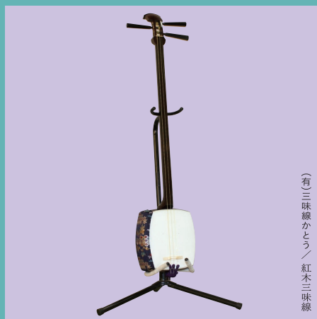
(有)三味線かとう / 紅木三味線