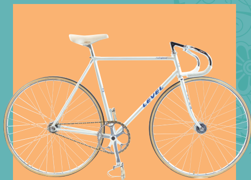
(株)マツダ自転車工場(自転車製造) / 2013年北米ハンドメイドバイシクルショー Presidents choice賞受賞 競輪競技用自転車