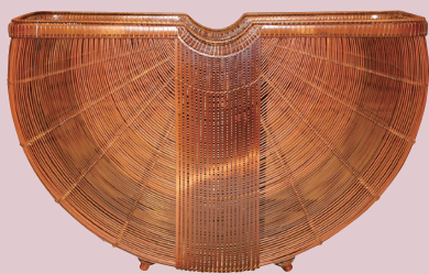
竹工芸 翠屋(竹工芸) / 花籠「月影」